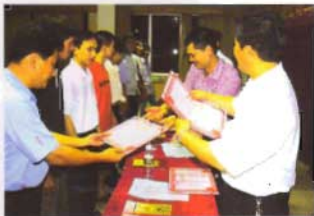
公司领导为先进个人颁发证书