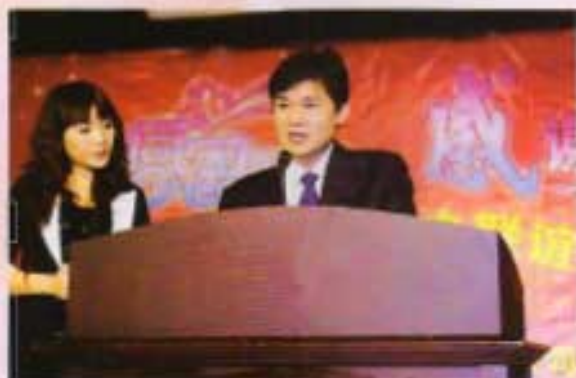
庄林锋总经理在大会上作热情洋溢的发言