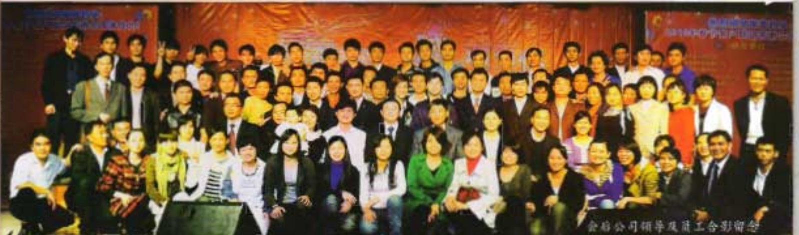
会后公司领导及员工合影留念